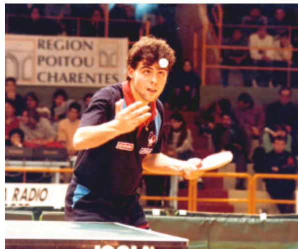
Poitiers le 17 décembre 1991 France-Allemagne en ligue européenne La période de la maturité technique

« Sur le plan technique, j'arrive à maturité dans les années 1990/1991. Tout le travail mis en place et basé sur la vitesse arrive à son maximum d'efficacité. C'est la période durant laquelle j'ai pris le plus de plaisir, la période durant laquelle j'avais la sensation agréable que mes adversaires étaient impuissants face au système de jeu que je développais. Ils n'avaient pas de réponses adaptées ».